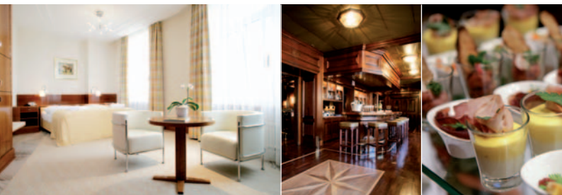
Einstein Hotel und Bar

Den Samstagabend verbringen sie in faszinierender Atmosphäre des Sommerfestivals am Bodensee in Bregenz. Auf dem Spielplan steht die legendäre Wüstenoper Aida von Guiseppe Verdi. Es ist die Geschichte einer Liebe bis in den Tod und eine moderne Parabel über Kriegslust, Nationalismus und Feindeshass. Mit unvergesslichen Eindrücken von der spektakulären Seebühne und einem Schlummertunk im Hotel wird der Abend ausklingen.